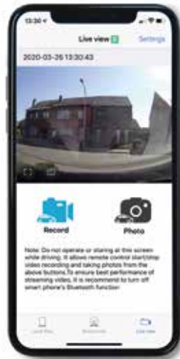
LIVEBEELDEN CAMERA VOORAAN