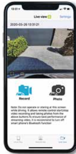
LIVEBEELDEN CAMERA ACHTERAAN